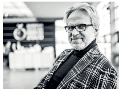
Alfonso Femia Architetto, co-fondatore nel 1995 di 5+1AA, dal 2017 Atelier(s) Alfonso Femia con sedi a Genova, Milano e Parigi.

il lavoro, l'appuntamento non poteva essere più puntuale nell'attuale contesto dell'emergenza sanitaria, che ha prodotto una forte accelerazione del fenomeno della trasformazione dei luoghi di lavoro. All Around Work si propone in primo luogo come punto di incontro tra domanda e offerta, con un percorso espositivo di nuova generazione organizzato in cinque aree tematiche (architettura, ingegneria, general contract, arredo per ufficio, tecnologie) e prevede un denso palinsesto di eventi, incontri, in presenza e in streaming, di assoluto valore per il mondo della progettazione e delle imprese